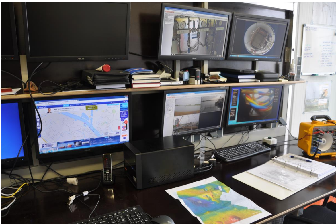
Foto: de uitkomsten van een bureauonderzoek worden gebruikt bij de uitvoering van een onderzoek waterbodems zoals hier te zien bij het onderzoek van de Kamper Kogge

Afhankelijk van de omvang van de toekomstige (planologische) ingreep en werkzaamheden, de aard van de aanleiding tot het bureauonderzoek en de vraagstelling, worden aanvullende gegevens verzameld.